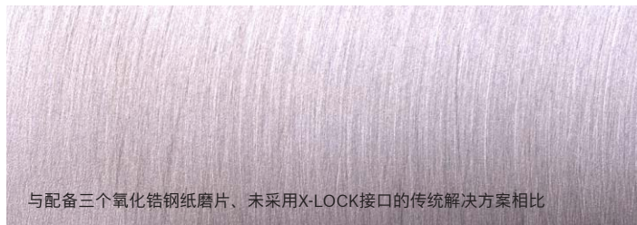
与配备三个氧化铝钢纸磨片、未采用X-LOCK接口的传统解决方案相比