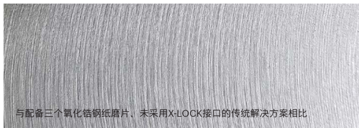
与配备三个氧化铝钢纸磨片、未采用X-LOCK接口的传统解决方案相比